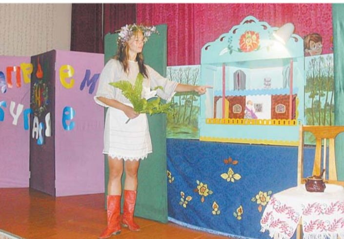
Народны тэатр «Батлейка» Залесскага дома культуры. Пастаўка «Пра бабу Еўку, купальскага дзедку і папараць-кветку».

У сакавіку наступнага года ў аграгарадку Залессе Смаргонскага раёна мяркуецца правесці міжнародны фестываль самадзейных батлеечных тэатраў.