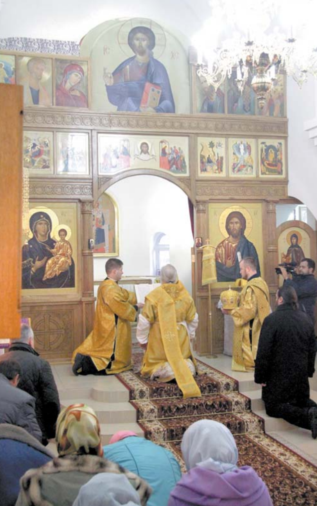
Набажэнства ў Міханавічах.

Днямі новы храм наведваў Патрыяршы Экзарх усяе Беларусі Мітрапаліт Мінскі і Заслаўскі Павел. Ён адслужыў тут літургію, звярнуўся да вернікаў з пропаведдзю.