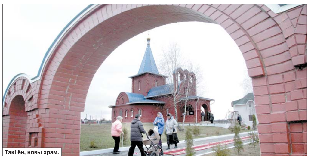
Такі ён, новы храм.