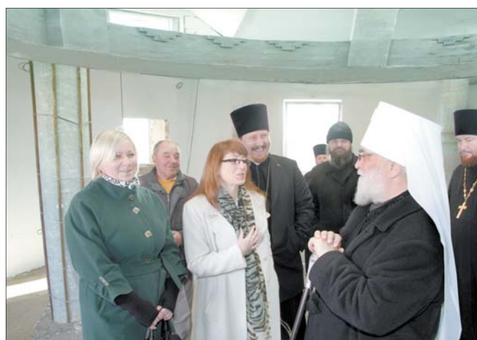
Патрыяршы Экзарх усяе Беларусі Мітрапаліт Мінскі і Заслаўскі Павел з прадстаўнікамі мясцовай і раённай улады ў памяшканні, якое будзе для царкоўнага прыхода.