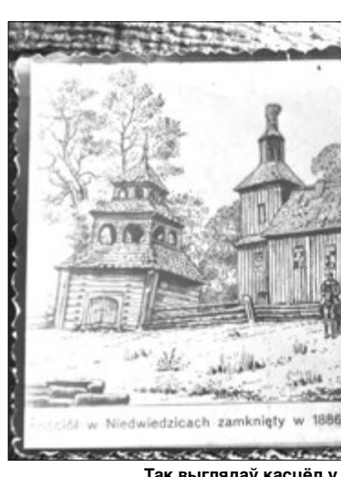
Так выглядаў касцёл у 1886 годзе.

Нагледзячы на гэта, вярнуць свой храм ім удалося толькі праз 20 гадоў — і тады ж зразумець, што замест старога, драўлянага будынка трэба ўзводзіць новы. Для гэтага прыхаджане ахвяравалі 60 тысяч рублёў (на той час — проста велізарныя грошы).