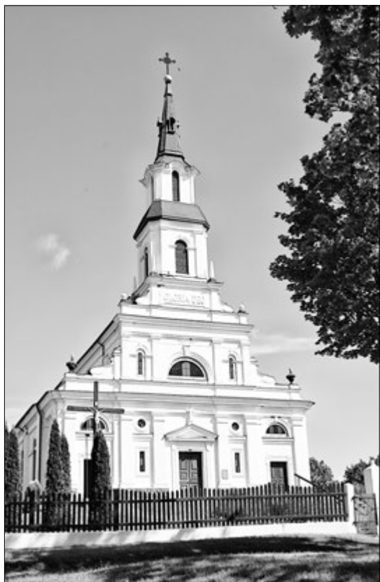
Касцёл святых апосталаў Пятра і Паўла.

як аднойчы прыехалі камуністы, каб з касцёла нешта забраць, дык яе бабуля Сарафіна з ім так ваваяла, што на пару месяцаў трапіла ў турму!