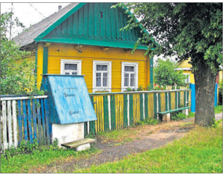
сельскагаспадарчыя ўгоддзі, якія знаходзяцца побач.

Пераважная большасць беларусаў мае доступ да цэнтралізаванага водазабеспячэння. Аднак толькі прадпрыемствы ЖКГ абслугоўваюць больш за 20 тысяч шхатавых калодзежаў па ўсёй краіне. І гэта калі не ўлічваць крыніцы, якія знаходзяцца на прыватных падворках.