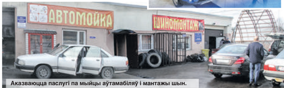
Аказваюцца паслугі па мыцці аўтамабіляў і мантажы шын.