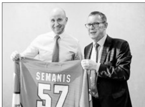
Старшыня Беларускай федэрацыі хакея Генадзь САВІЛАЎ і Эйнарс СЕМАНИС.

Нагадаем, права сумеснага правядзення турніру ў 2021 годзе краіны атрымалі на гадавым кангрэсе ІІХФ у маі 2017 года.