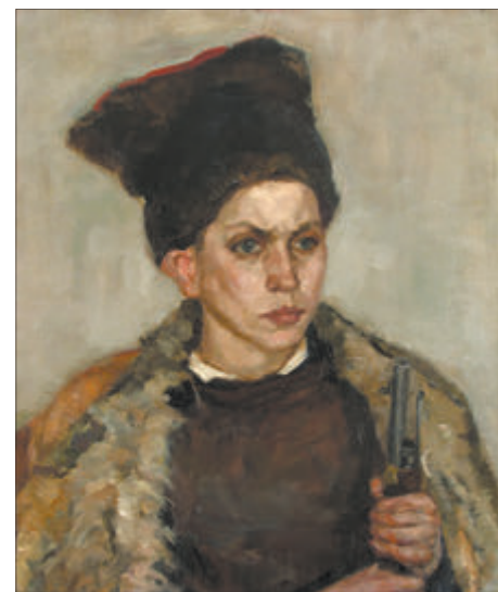
Яўген Аляксеевіч Зайцаў (1908—1992). «Партрэт юнага партызана». 1943 г. Палатно, алей.