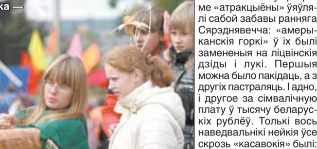
Страляць з лука — цэлая навука.

На сцэне стаялі ўдзельнікі «Старога Ольсы». У адаптаваным адзенні, у смешных чаравіках, з шыкоўнымі па гучанні музычным інструментамі, яны больш паходзілі на казанчых эльфаў... Песня заканчвалася, і лідар гурта пытаўся ў публікі, што яна хоча папачуць зараз. Выбар сапраўды быў: за плячым гурта восем альбомных... «Ружу давай! Ружу!». «У карме!!!», «У карме!!!» Многія добра ведалі дзве маленькія дзядзькіны гудоў сямі. Стоячы ў эпіцэнтры, маляў трымалі ў руках тая самыя пафарбаваныя дудкі за 6 тысяч, пра якія ўзгадваўся вышэй. Ды не проста трымалі, а прысядаючы ў такт з музыкай, з усёй моцы ў іх дулі, стараючыся прычыніцца да