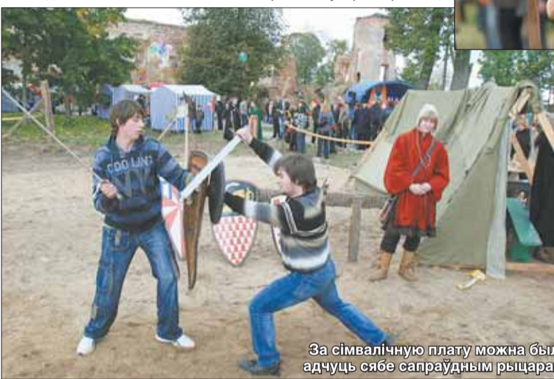
За сімвалічную плату можна было адчуць сябе сапраўдным рыцарам.

ўзяты кірунак у народную сферу, у Польшчы развіццё набыла музыка камернага кірунку. Туртоў, якія б выконвалі і камерную, і народную, і духоўную музыку, і т.зв. «вулічны» фальклор, вельмі мала. Чэхія, Германія, Францыя — вось, відавочна, самыя перадавыя краіны ў гэтым. І нас гэты ўзровень з натуральным гукаўспрымальным інструментамі таксама добры. Бліэй пад абед пляц ля Гальшанскага замка ўсё напаяўся — людзей прыязджала ўсё больш. — Прыехалі ўсёй сям'ёй